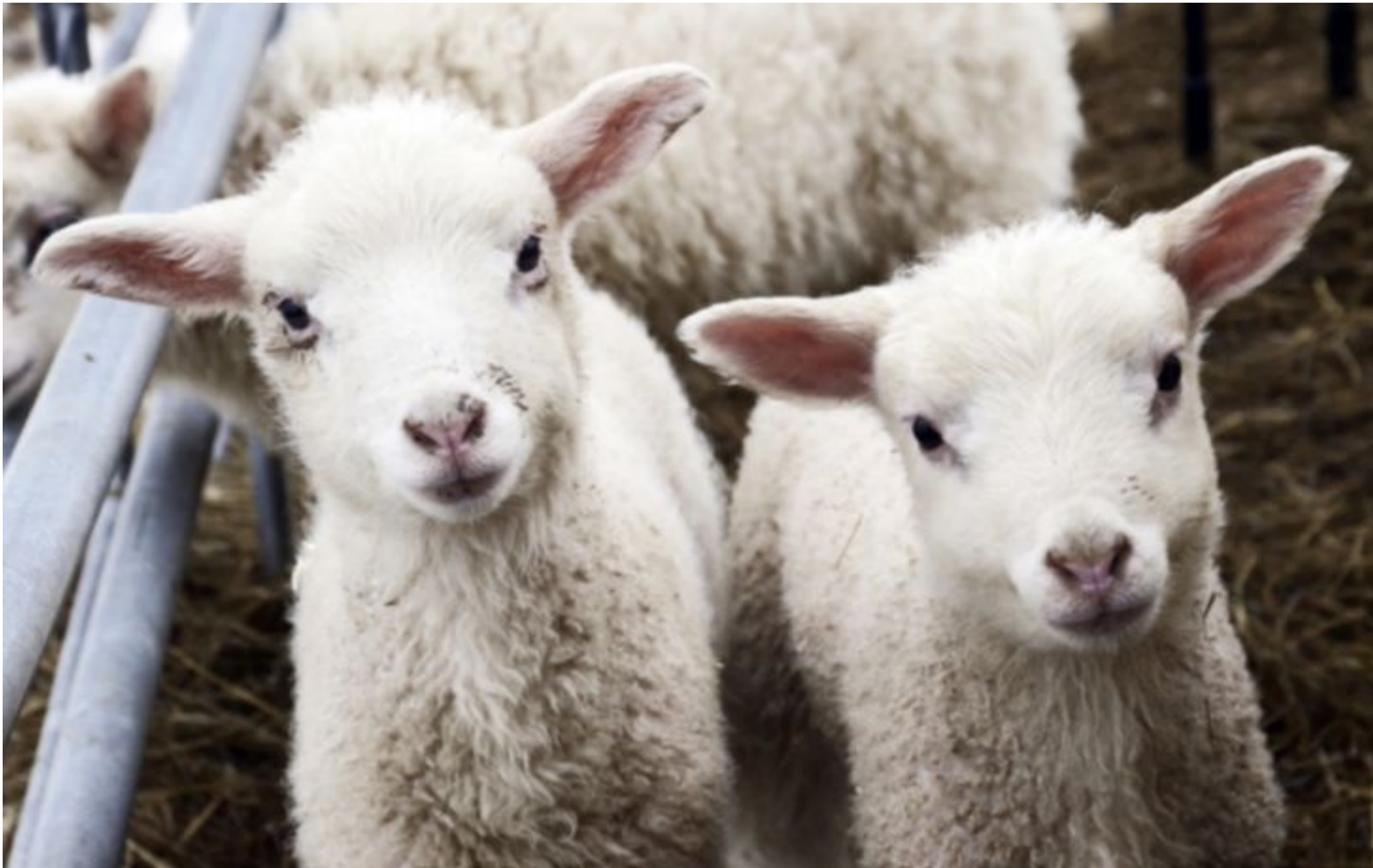
Bra matvara. Lamm har framtiden för sig, och då på tallriken, enligt konsultrapporten där ökad djurproduktion efterlyses.